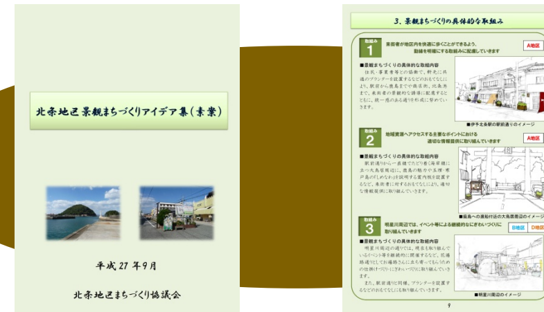
【ご確認いただいた『景観まちづくりアイデア集(素案)』の冊子】

〒790-8571 松山市二番町4丁目7-2 Tel. 089(948)6848 Fax. 089(934)1807