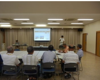
松山市による説明の様子