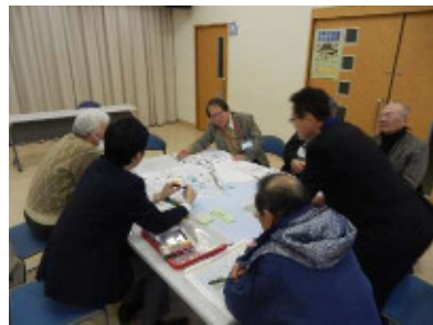
意見交換の様子(1班)