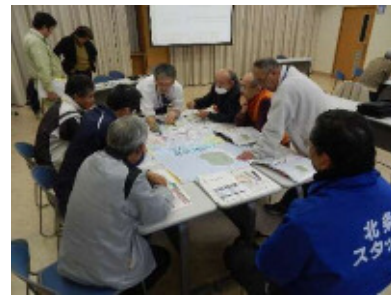
意見交換の様子(2班)