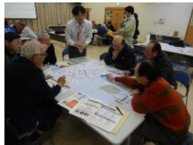
意見交換の様子(3班)