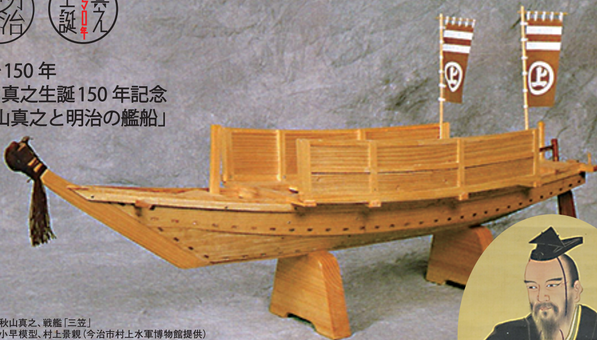
写真上: 秋山真之、戦艦「三笠」 写真下: 小早模型、村上景親