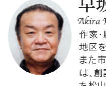
早坂 暁氏 (本名 富田 祥資) Akira Hayasaka 昭和4年8月11日～平成29年12月16日 作家・脚本家。代表作「花へんろ」をはじめ、生まれ育った北条地区をたびたび作品に取り上げ、本市の全国的な周知に尽力。また市制100周年を記念して創設した「坊っちゃん文学賞」では、創設から30年にわたり審査員を務め、「ことばと文学のまち松山」の発展に貢献された。(平成30年2月16日授与)