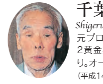
千葉 茂氏 Shigeru Chiba 大正8年5月10日～平成14年12月9日 元プロ野球選手・野球評論家。名二塁手として巨人軍の第1・第2黄金期を築いた。近鉄監督も務め、昭和55年に野球殿堂入り。オールスターゲームの松山誘致に尽力された。(平成14年7月12日授与)