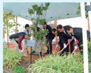
姉妹都市提携30周年記念植樹式