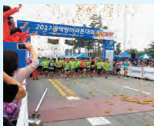
毎年秋に開催の平澤港マラソン大会

両市で開催されるマラソン大会への参加や、サッカー交流など、スポーツや青少年の交流を行っています。