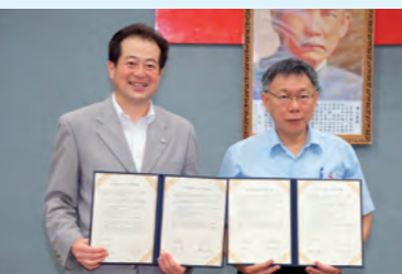
台北市との友好交流協定再調印