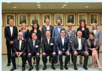
代表団による市長表敬訪問

フライブルク市は、13世紀初頭から3世紀を要して建てられたミュンスター（大聖堂）などの歴史的文化遺産が多く残る、中世の雰囲気包まれたまちです。環境重視のまちづくりを進めていることから「エコポリス（環境都市）」とも呼ばれており、両市の環境会議に相互に出席するなど、交流を深めています。平成30年には、姉妹都市提携30周年を記念して、フライブルク市長をはじめとするフライブルク代表団が来松し、まつやまRe・再来館で記念植樹を行うなど、友好を深めました。