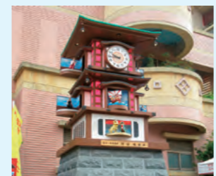
松山国民小学校前にある「幸福からくり時計」

漢字で同じ「松山」という地名や、共に最古といわれる温泉があることを縁として、交流を開始しました。観光・文化・スポーツなど幅広い分野で交流を進め、平成31年は友好交流協定5周年を迎えます。