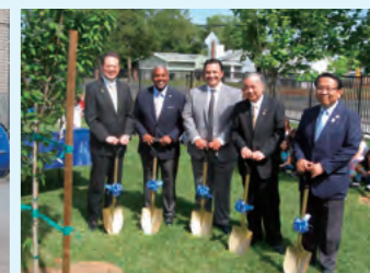
姉妹校での記念植樹