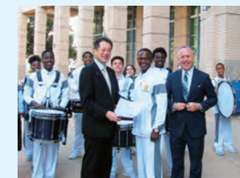
ダレル・スタインバーグ市長と姉妹校の生徒による歓迎

平成28年に姉妹都市提携35周年を迎え、平成29年には記念訪問団がサクラメント市を訪問しました。松山市のPRのほか、姉妹校提携調印式への出席や記念植樹を行うなど交流を深めています。