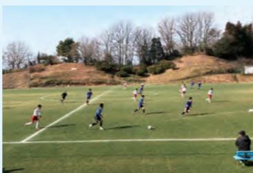
平澤FC U-18とのサッカー交流