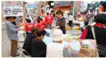
今年のイベントの様子

暮らしに役立つ情報がいっぱいの「みんなの生活展2018」を開催します。まつやま農林水産物ブランド「紅まどonna」や道後温泉別館「飛鳥乃湯泉」入浴チケットが当たるスタンプラリーなど楽しいイベントもいっぱいです。