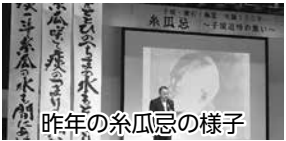
昨年の子規忌の様子