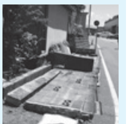
平成19年新潟県中越沖地震