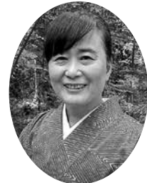
俳都松山大使の夏井いつきさん

申し込み 7月1日(日)～23日(月)(消印有効)までにはがき・eメール(いずれも1人1通)で、住所、氏名、電話番号、申し込み人数(2人まで)を〒790-8571文化・ことば課