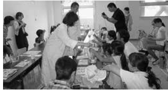
水をきれいにする実験