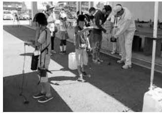
水道管の漏水調査体験