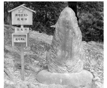
昭和43年に松山城長者ヶ平に設置した第1号俳句ポスト

(市役所本館5階) haito@city.matsuyama.ehime.jp へ(8月下旬に整理券を発送)