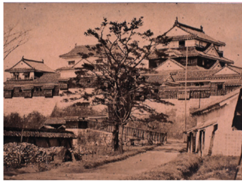
明治時代の松山城

申込 5月27日(日)(必着)。はがき・ファクス・eメールで、住所、氏名、電話番号、講座名を〒790-0001一番町三丁目20坂の上の雲ミュージアム講座係 saka-museum@city.matsuyama.ehime.jpへ 会場 坂の上の雲ミュージアム事務所 ☎915-2601・FAX 915-3600