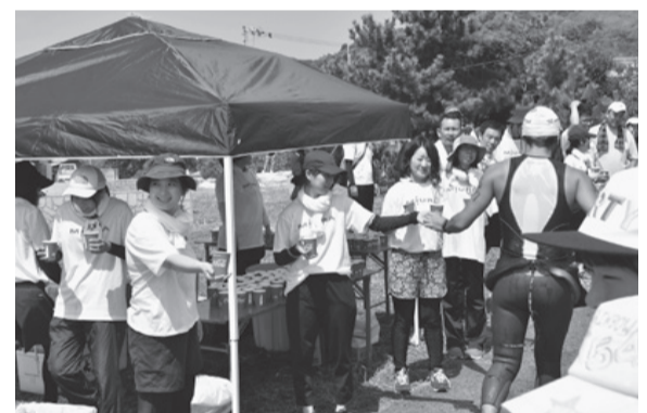
昨年のボランティアの様子

申し込み 6月22日(金)(消印有効、eメールは17時)までに、はがき・電話・ファクス・eメールで、住所、