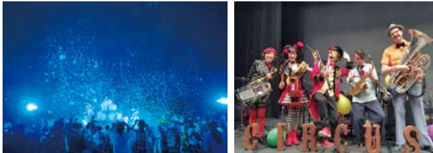
大巻伸嗣「Memorial Rebirth」参考作品:「Memorial Rebirth 気仙沼」2015©Shinji Ohmaki Studio ジントラムータのライブ 参考作品:サーカスショー「楽団と道化師」@きらり☆ふじみ2017

【日時】4月14日(土)13~18時・15日(日)13~15時 【会場】道後温泉別館 飛鳥乃湯泉(道後湯之町)中庭など