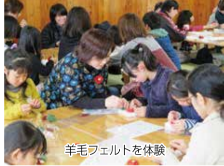
羊毛フェルトを体験

1月28日「いい、つばきの日」を皮切りに、市内各地で市の花「つばき」に関するイベントが開催されています。 2月3日、風早活性化協議会と北条児童センターの共催で、「羊毛フェルト