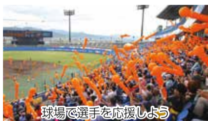
球場で選手を応援しよう

3市3町の特産品が当たる大抽選会や体験型のストラックアウト、ティーバッティング、さらに今話題の「VRスキージャンプ体験」などを開催。家族そろって楽しもう!