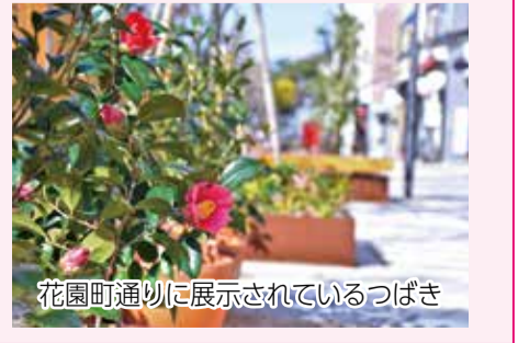
花園町通りに展示されているつばき

つばきフェスティバル2018に合わせ、「伊予つばき20選」に選ばれた品種など約30品種、80鉢の「つばき」の鉢植えを花園町通りに展示しています。つばきが見頃を迎える季節ですので、ぜひご覧ください。 ☎公園緑地課 ☎948-6854・☎934-8723