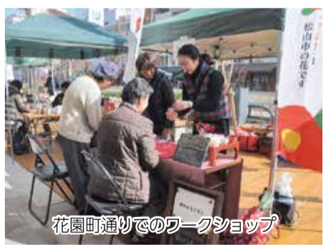
花園町通りでのワークショップ

また2月18日、毎週第3日曜日(日)に花園町通りで開催している「お城下マルシェ花園」で、つばきの香りをイメージしたアロマオイルを使ったワークショップを実施。訪れた人たちはつばきの香りのオリジナルキャバルを盛り上げました。