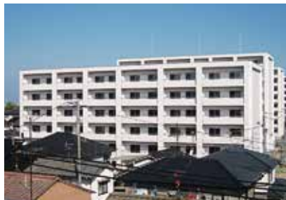
第一和泉団地の外観