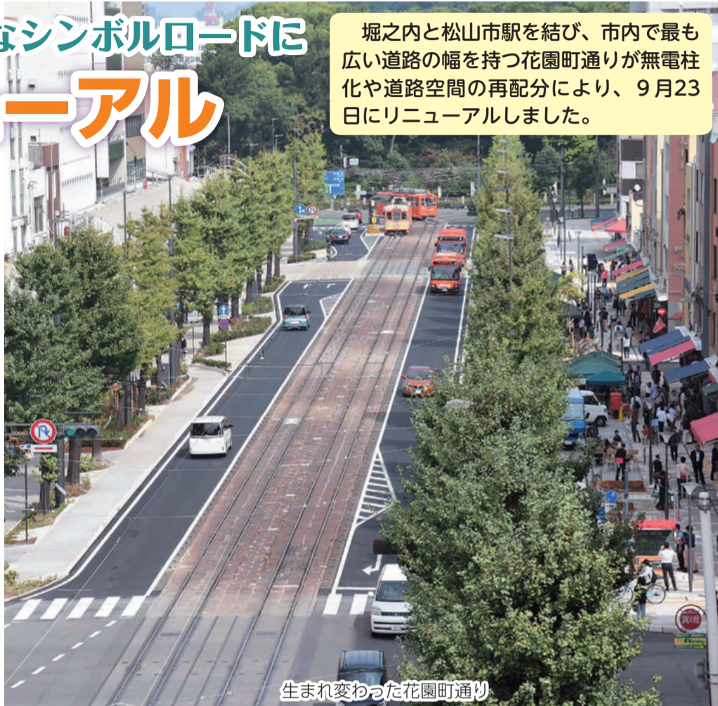
生まれ変わった花園町通り