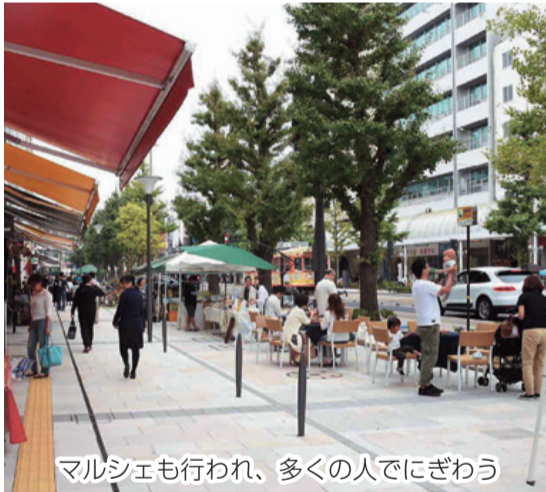
マルシェも行われ、多くの人でにぎわう