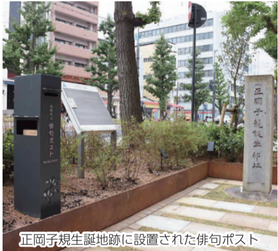
正岡子規生誕地跡に設置された俳句ポスト