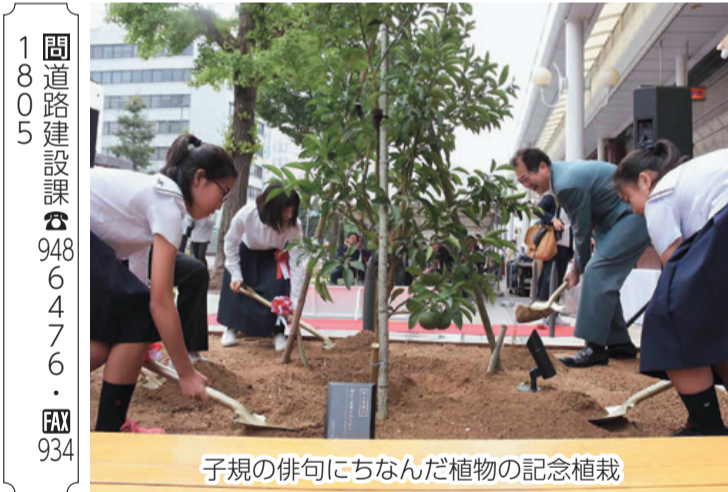
子規の俳句にちなんだ植物の記念植栽