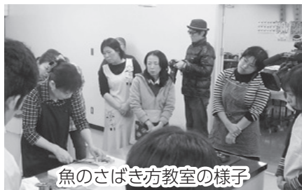
魚のさばき方教室の様子

日時 10月14日(土)10～13時 会場 水産市場(三津ふ頭) 2階調理室 ※無料駐車場あり