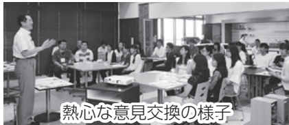
熱心な意見交換の様子

野志市長は、「皆さんが中心になってこれからの松山市をつくっていくので、これから遠慮なく意見を言うてほしい」と話しました。 ●市内中心部に新鮮な野菜や魚を買える場所があれば