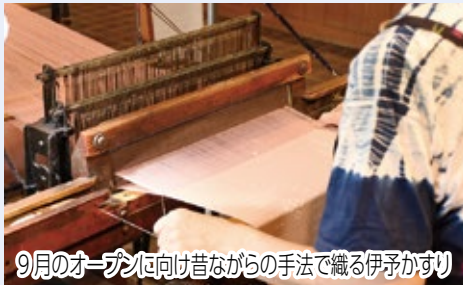
9月のオープンに向け昔ながらの手法で織る伊予かすり

伊予かすりは今後何十年も後世に伝えていきたい大切な宝です。飛鳥乃湯泉を通じて伊予かすりの良さを改めて実感してほしいと思います。