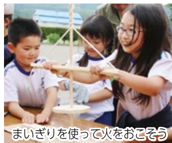
まいぎりを使って火をおこそう

【日時】8月27日(日)15時~ 【会場】城山公園(堀之内) 【内容】「まいぎり」を使って火をおこすほか、ステージイベントや飲食ブースあり(雨天決行) 【対象・定員】市内在住の人(小学生以下は保護者同伴)。700人(抽選) 【申し込み】7月31日(月)(消印有効)。往復はがきに代表者の住所、氏名、電話番号、参加人数を、返信用はがきの宛名面に、代表者の住所、氏名を明記し、〒790-0001一番町四丁目2 NTTコム松山ビル6階 愛顔つなぐえひめ国体・えひめ大会松山市実行委員会へ