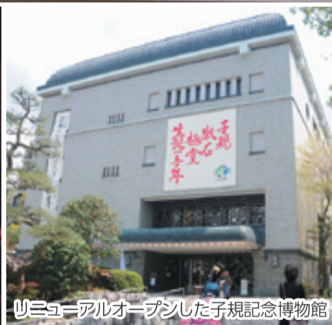
リニューアルオープンした子規記念博物館

今回のリニューアルでは9カ所に新たな展示や設備を導入。「愚陀佛庵」復元コーナーには建物全体を俯瞰できる模型や子規と漱石の日々を紹介する「愚陀佛日記」のほか、新たに障子をスクリーンにした映像コーナーを設置。「愚陀佛庵」の果た