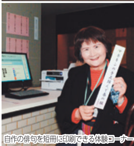
自作の俳句を短冊に印刷できる体験コーナー