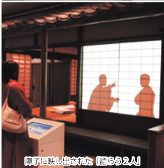
障子に映し出された「語らう2人」