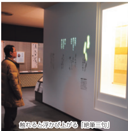
触れると浮かび上がる「絶筆三句」

正岡子規・夏目漱石・柳原極堂生誕150年を記念し、子規記念博物館の常設展示室をリニューアル、4月1日にオープンしました。