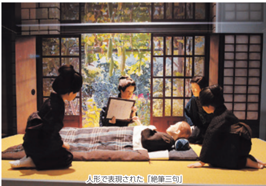
人形で表現された「絶筆三句」