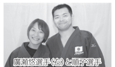
廣瀬悠選手(右)と順子選手

リオパラリンピック柔道競技に出場した廣瀬悠選手と同競技で日本人初の女性メダリスト・廣瀬順子選手をゲストに迎えトークショーを開催します。