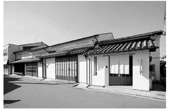
補助金を活用して整備した建物

申し込み 随時受け付け。直接または郵送・ファクス・eメール。寄付申請書(事業計画書などと同所にあり)を都市デザイン課 design@city.matsuyama.ehime.jp へ