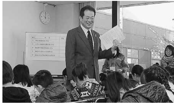
授業をする野志市長

市内の小・中学生に仕事を体験してもらい、働くことの楽しさや厳しさを学び、地元企業への関心と理解を深めてもらう。平成28年12月18日、「キッズジョブまつやま2016」が開催され、医療・福祉・サービス業など61ブースに約1600人が訪れました。 今回は市長体験ブースが設けられ、野志市長が授業を行いました。授業では子どもたちが「松山市長」になり、福祉や観光、教育など10の課題に対し、どの分野をどのくらい重視し予算配分をするか疑似体験し、意見交換。子どもたちは悩みながらも、思い思いに予算を配分していました。