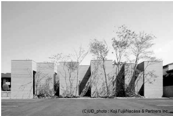
第9回きらめき大賞 森の回廊-L∞P-/大谷歯科矯正歯科