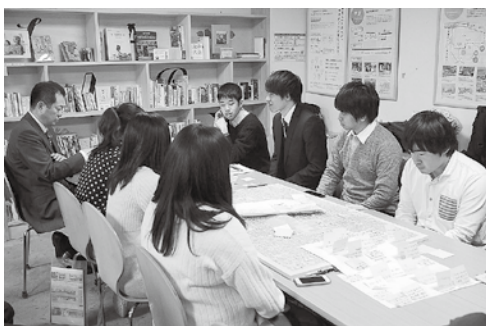
活発な意見交換の様子