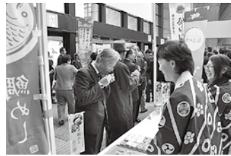
鯛めしを試食する参加者

会場では、まつやま農林水産物ブランド「紅まどん」や「ぼっちゃん島あわび」や鯛めしの試食コーナーなどが設けられたほか、1年間の市政記録を紹介した動画を上映しました。