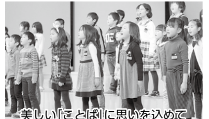
美しい「ことば」に思いを込めて

小学生による「群読(複数人による朗読)コンクール」が2月19日、総合コミュニティセンターで開催されます。思いを込めた美しい“ことばのハーモニー”を会場でお楽しみください。