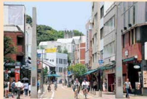
松山城への玄関口であるロープウェイ街

夜間でも安全・安心なまちへ ロープウェイ街は楽器店・骨董品店・画廊など古くからの文化薫る店舗が多くあり、夜間にはライトアップされ情緒あるまち並みです。防犯カメラ設置などにより安全・安心できれいなまちになりました。観光客にもっと通っても