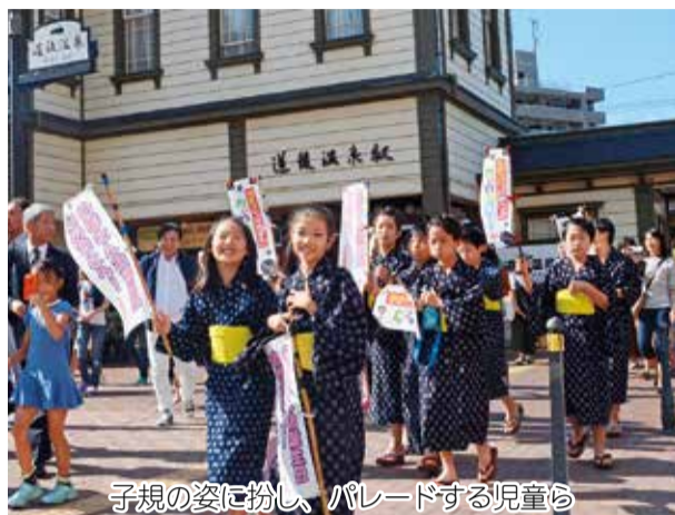
子規の姿に扮し、パレードする児童ら

申し込み 誕生日の前月1日（必着）までに、郵送・eメールで赤ちゃんの写真、氏名（ふりがな）、性別、生年月日、住所、電話番号（郵送の場合は写真の裏に記入）を、〒790-8571 シティプロモーション推進課 ☎kouho-baby@city.matsuyama.ehime.jpへ（応募多数の場合は抽選。応募写真は返却しません。なお、この紙面は市ホームページに掲載します）