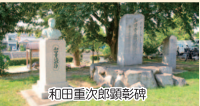
和田重次郎顕彰碑

重次郎が育った日の出町の石手川緑地には顕彰会により記念碑や胸像のほか、アラスカにちなんだ「日の出町オーロラ遊歩道」が設置され、地域住民による清掃活動などで大切に管理されています。