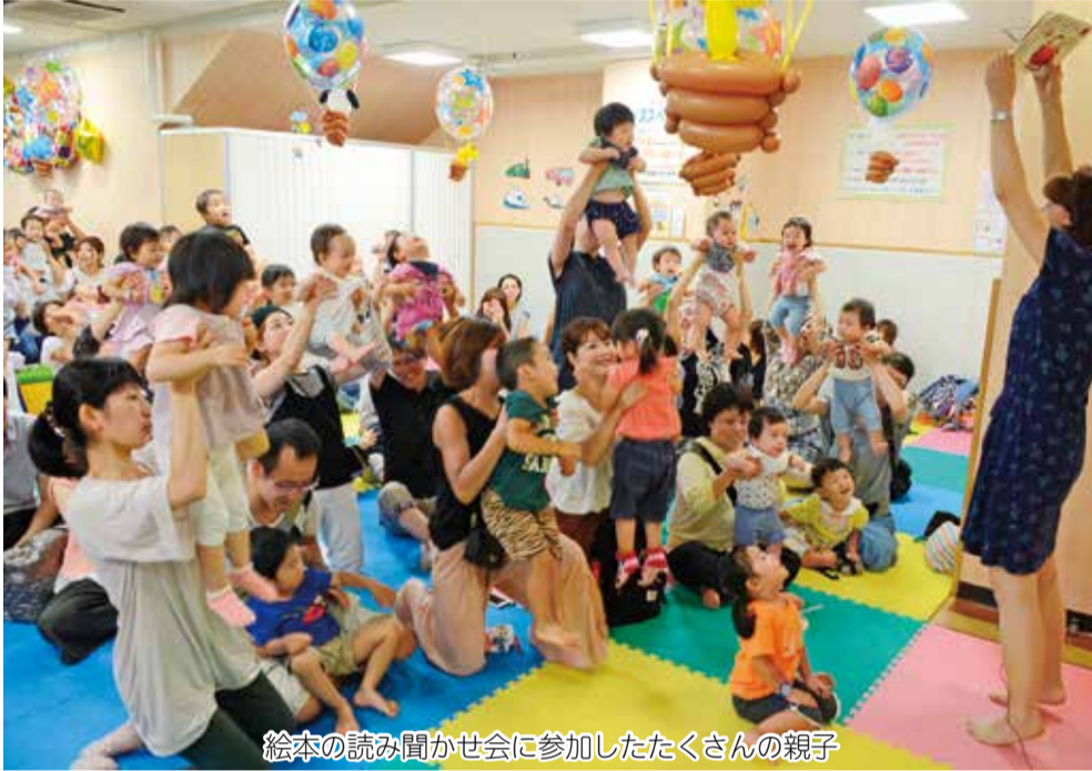
絵本の読み聞かせ会に参加したたくさんの親子