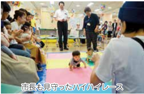
市長も見守ったハイハイレース