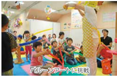
バルーンアートに挑戦

当日は「ハイハイレース」をはじめ、絵本の読み聞かせやバルーンアート体験など普段から人気の高いイベントをまとめて開催したほか、大街道中央商店街振興組合と連携し「おおかいどう移動水族館」を特別に出展、訪れた多くの家族連れでにぎわいました。