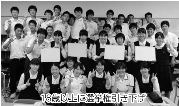
18歳以上に選挙権引き下げ

※選挙に関する情報は、市ホームページやフェイスブックにも掲載しています。 http://www.city.matsuyama.ehime.jp/shisei/senkyo/ https://www.facebook.com/matsuyamassenkan