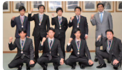
M・D(松山デスペラード) 平成27年12月6日受賞