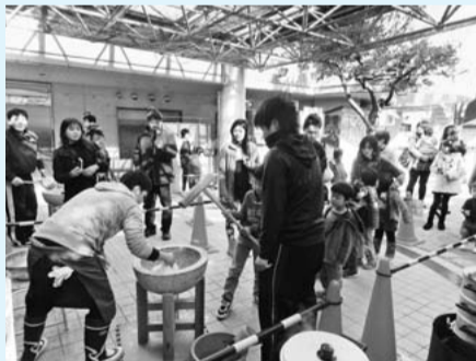
☎ 12月26日(土)12~16時。餅つき体験・試食、昔あそび体験

各締め切り日(必着)まで。往復はがきまたはファクス、各館ホームページで住所、参加者全員の氏名(ふりがな)、学校名・学年、電話番号、保護者氏名を各児童館「〇〇係」へ