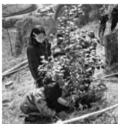
かん養林の植樹風景