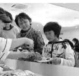
山芋の重量当てゲームの様子

回 11月23日(月) 回 11月15日(日)「滝まつり」 回 11月23日(月)「祝まつり」 回 11月23日(月)「祝まつり」 回 11月23日(月)「祝まつり」