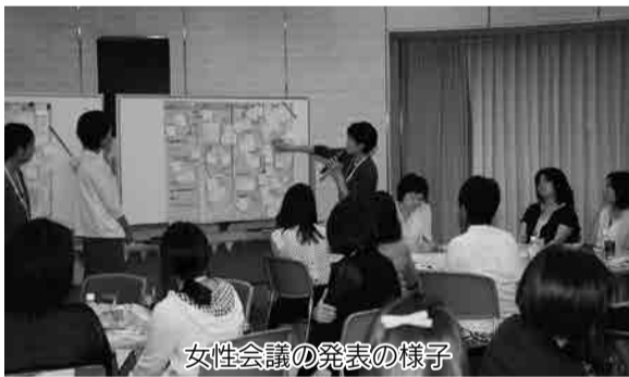
女性会議の発表の様子

■女性会議 参加者32人は4つのグループに分かれ、結婚、妊娠・出産、子育てなどについて討論。その後グループごとに意見をまとめて発表しました。「企業の妊娠・出産についての理解度が低い。制度の充実を」「若い世代の結婚願望が低下している。広く出会いの場を提供してほしい」といった意見が出されました。