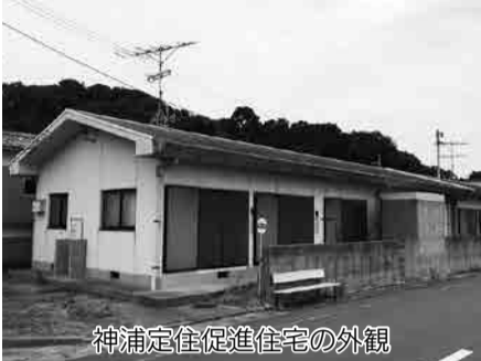
神浦定住促進住宅の外観

対象 市島しょ部居住者以外で島への移住を検討している人 ※11月3日(火・祝)面接審査あり