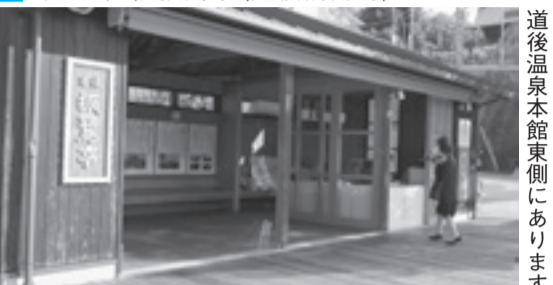
道後温泉本館東側にあります 問 松山アーバンデザインセンター ☎968-2920・☎968-2921

日 3月21日(土・祝)・22日(日)。9～16時 会 道後温泉本館周辺 内 源泉の歴史をさかのぼる最長約6、7kmのクイズラリー(抽選で景品プレゼントあり)▶ガイドが観光資源や各源泉の歴史背景を解説する約1kmのウォーキング 申 当日、直接振鷺亭(道後湯月町)へ