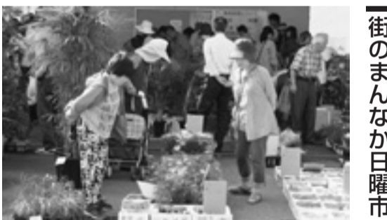
多くの人でにぎわう日曜日

日 3月22日(日) 9～15時 会 中央卸売市場(久万ノ台) 内 野菜、果物、乾物、野菜ソムリエによる野菜ジュース販売、ご当地グルメ販売、オークション、景品入り餅まきなど 問 街のまんなか日曜日実行委員会 ☎9241924・☎9241944・市場管理課 ☎9242311・☎9259944