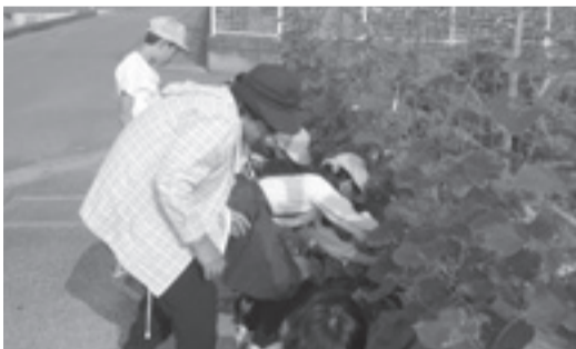
地域の名人と一緒に野菜を収穫

イモを栽培しました。地域の野菜作りの名人にアドバイスを頂きながら育てた野菜は、すくすく成長し、収穫期にはたくさん夏野菜が実りました。子どもたちは野菜の生命力に感動しながら、愛情を持って世話をすることができました。そして、いのちある