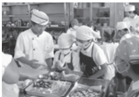
松山城南高校の生徒から調理を学ぶ