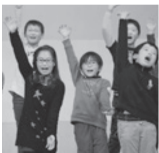
大賞の「にこにこ☆shimizu42」の群読

お問い合わせは、文化・スポーツ振興課 ☎948 6634・FAX 934 1287へ