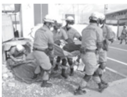
倒壊した建物から生存者を救助

18日に城北支署で行われた訓練は、倒壊した建物内に取り残された人を救助するもの。訓練は、想定状況を一切明かさずに行われ、災害現場の状況や生存者の有無の確