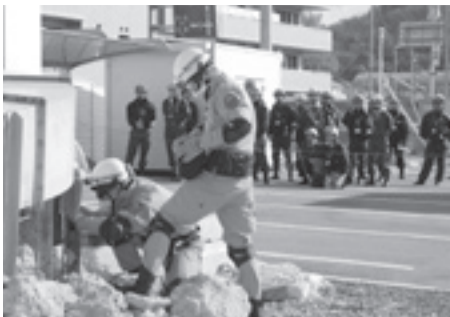
取り残された人を捜索

海外で大規模な災害が発生した際に、被災国の要請に応じて救助活動を行う国際消防救助隊の四国地区合同訓練が2月17・18日、初めて松山市で実施されました。