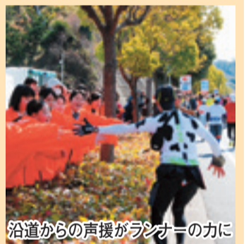
沿道からの声援がランナーの力に

交通渋滞に注意 大会当日は、市内全域で交通渋滞が予想されます。外出の際は迂回路のご利用をお願いします。 お問い合わせは、愛媛マラソン実行委員会 ☎9158460 FAX 91523088 http://ehimemarathon.jp/