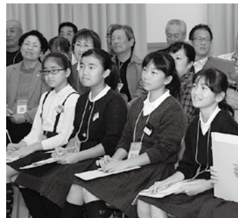
熱心に話を聞く小学生

市道河野五明線の中須賀橋から下流側を平成26年8月に整備しました。また上流側は12月から測量を行う予定です。