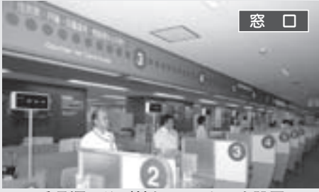
番号順に並び替え、ついでを設