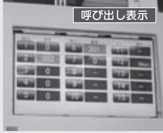
呼び出し表示 分かりやすい画面で窓口へご案内