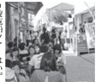
食を楽しむ人らでにぎわう三津浜商店街

古い街並みや個性豊かな食文化など、魅力あふれる地域資源が多く存在する三津浜地区の新たなにぎわいと交流創出を図るため、平成26年3月、「三津浜地区活性化計画」を策定しました。その中で、空き家・空き店舗情報を集約