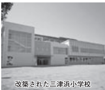
改築された三津浜小学校