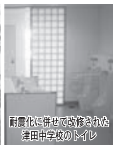
耐震化に併せて改修された津田中学校のトイレ