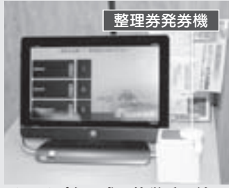
タッチパネル式で簡単受け付け