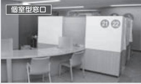
個室型窓口 窓口センター南端に設置し、外部からの視線を遮断