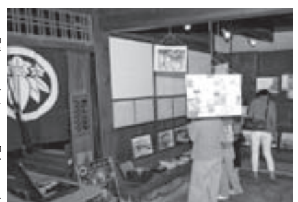
空き家情報の提供や相談に応じる町家バンク「三津ハマル」