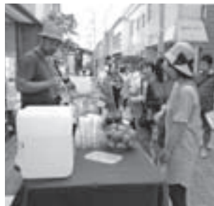
個性的な店が出し各店舗で行列が

なじみがある店を一度に楽しめるのが三津浜のいいところ。三津浜は古民家が多く残り、いい雰囲気のみちです。