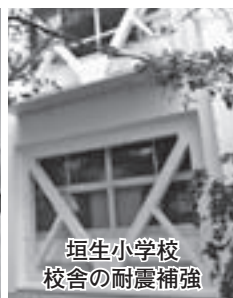
垣生小学校 校舎の耐震補強