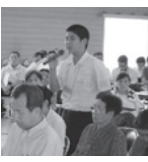
活発に意見を出す中学生

お問い合わせは、タウンミーティング課 ☎ 948 6333 FAX 934 2336