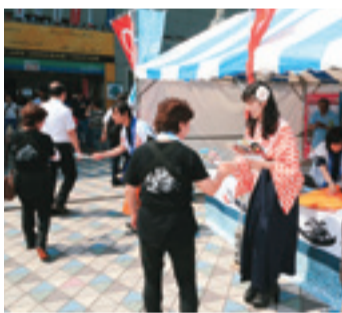
松山マドンナ大使らが来場者をおもてなし