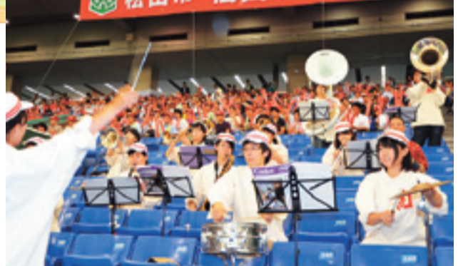
再現された明治時代のユニホームを着て演奏する brass band

応援には本市などから約1200人が駆け付け、早稲田大学の応援団と一体となって声援を送り、野球サンバや伊予之国松山水軍太鼓など郷土芸能も披露され、チームを鼓舞しました。またドーム周辺の観光物産テントでは来場者にタオルやうちわなどを配布し、本市の観光情報もPRしました。