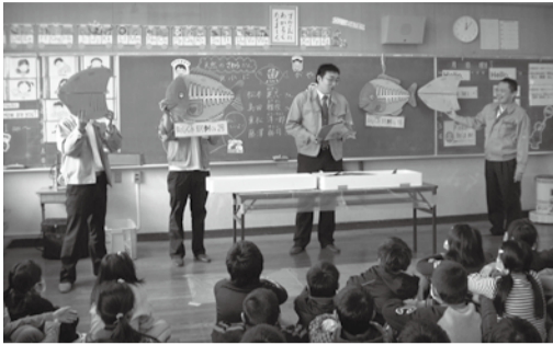
魚の体のしくみを楽しく学ぶ小学生

市民の皆さんが集まる場に市職員が伺い、下記テーマに沿って市政の取り組みについて説明や意見交換を行う「笑顔のまつやままちかど講座」をぜひご利用ください。 【期間】平成27年3月31日(火)まで(年末年始を除く) 【時間】9時30分～21時30分(土・日曜・祝日は18時まで)。 1テーマ2時間以内。 ※子ども版は9時30分～18時の間で1時間程度 【対象】市内在住または通勤・通学している10～30人程度のグループ。子ども版は保護者代表の同席が必要 【場所】市内の会場を申込者が準備(会場使用料は申込者が負担) 【申し込み】開催希望日の2週間前(必着)までに、直接または郵送、ファックス、eメールで所定の申込書(市役所本館1階案内所・支所・公民館・市ホームページ)を〒7908571タウンミーティング課(市役所本館9階) town-m@city.matsuyama.ehime.jp