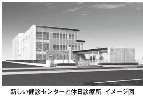
新しい健診センターと休日診療所 イメージ図

市医師会 健診センターと休日診療所 移転 市医師会館の移転に伴い、健診センターと休日診療所も移転します。 【移転先】藤原二丁目4-70