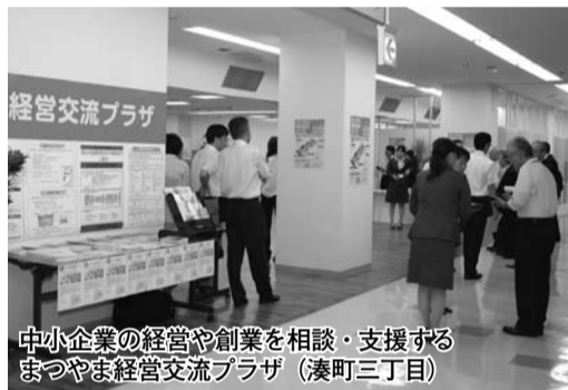
中小企業の経営や創業を相談・支援する まつやま経営交流プラザ（湊町三丁目）

本市における創業の促進と本市の産業の多くを支える中小企業に対する販路拡大や、経営基盤強化などへの支援をより充実させ、地域経済の活性化や雇用の増大を図るため、産業経済部地域経済課に「中小企業応援・雇用担当課長」を配置します。また消費税引き上げによる景気の腰