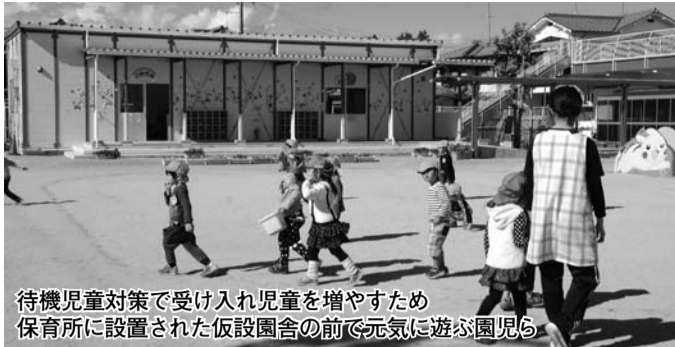
待機児童対策で受け入れ児童を増やすため 保育所に設置された仮設園舎の前で元気に遊ぶ園児

育の総合的な提供により、住民サービスの向上を図るため、子ども・子育て担当部長の下に「保育・幼稚園課」を設置します。