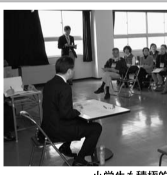
小学生も積極的に発言

指し1月26日「消防出初式」が城山公園で開催され、消防関係者ら約2000人が参加しました。式では、はしごの上での演技や水軍太鼓、一斉放水などが披露され、防災への決意を新たにしました。