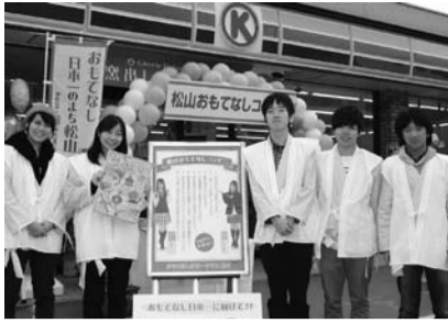
認定パネルと松山大学Museのメンバー

「おもてなし日本一」を目指す本市では、地域と一体となって休憩や観光案内などのおもてなしを実施する「松山おもてなしコンビニ」を創設し、その第一弾と