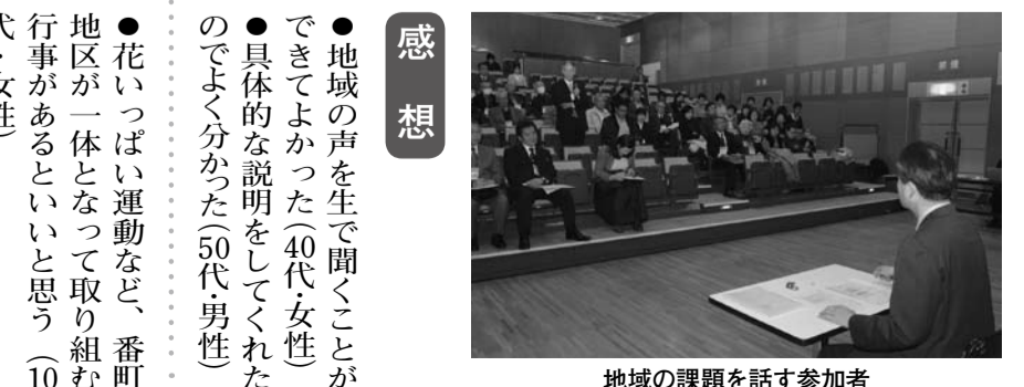
地域の課題を話す参加者

第19回 番町地区 2月2日(日)開催 参加者33人 人口3339人 世帯数1884世帯 (2月1日現在)