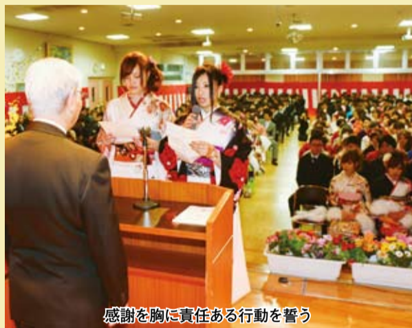
感謝を胸に責任ある行動を誓う

市勢 平成26年1月1日 現在推計(前月比) ■面積:429.06km 2 ■人口:516,643人(-109) ■男:241,166人 ■女:275,477人 ■世帯数:229,916世帯(-82) ■1世帯の平均:2.25人 ■人口密度:1,204人/km 2