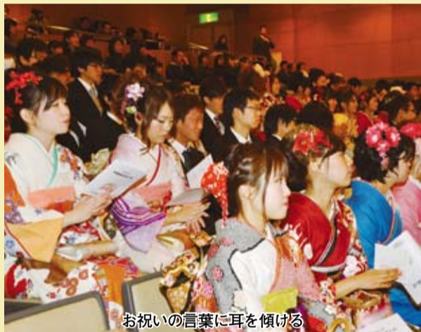
お祝いの言葉に耳を傾ける