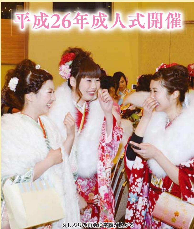
久しぶりの再会に笑顔が広がる