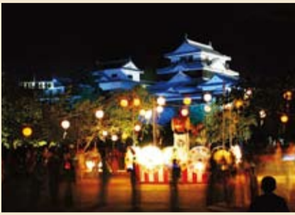
「光の城」を背に盆踊り

誕生日の前月1日(必着)までに、郵送・eメールで赤ちゃんの写真、氏名(ふりがな)、性別、生年月日、住所、電話番号(郵送の場合は写真の裏に記入)を、〒790-8571広報課 kouho-baby@city.matsuyama.ehime.jp へ(応募多数の場合は抽選・応募写真は返却しません)