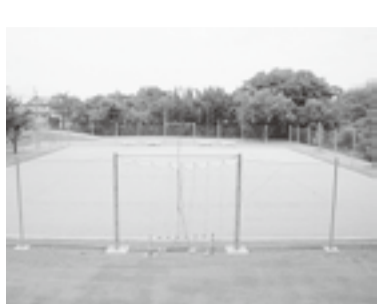
完成したビーチバレーコート