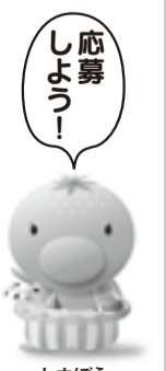
応募しよう! しまぼう