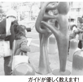
ガイドが優しく教えます!

【日時】8月4日(日)8時30分〜10時30分▼集合11時20分(放生園(道後湯之町)) 【対象】小学生とその保護者(乳幼児の同伴は不可) 【定員】各20人(先着順) 【料金】小学生1人500円、保護者は無料 ※別途、交通費が必要 【申し込み】7月31日(水)までに、eメールまたは電話で、保護者氏名、参加児童全員の氏名、学校名、学年、住所、電話番号を松山はいく事務局 matsuyamahaku@gmail.com ☎9456445へ