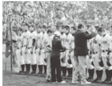
パネルや映像で激闘の記憶が再び...!

の・ボールミュージアム(市坪西町)では、2013春の選抜高校野球大会における清美高校の優勝を祝して、特設記念展を開催中です。あの感動をもう一度味わってみませんか。