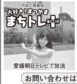
愛媛朝日テレビで放送