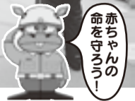
赤ちゃんの命を守ろう!

【日時】7月20日、8月17日、9月21日、10月19日、11月16日、12月21日。いずれも土曜日9時30分〜12時30分