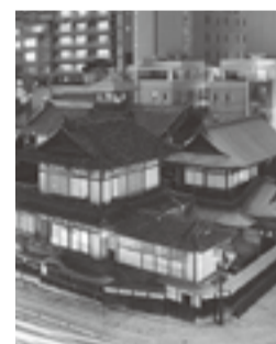
道後がアート一色に

道後オンセナート 2014 12/24開幕 道後温泉本館改築120周年を記念し、「最古にして最先端。温泉アートエンターテイメント」をテーマに道後温泉本館とその周辺でアートフェスティバルを開催します。10月のプレイイベントを経て、12月24日から1年間にわたり、光や映像、作品展示で道後を彩ります。