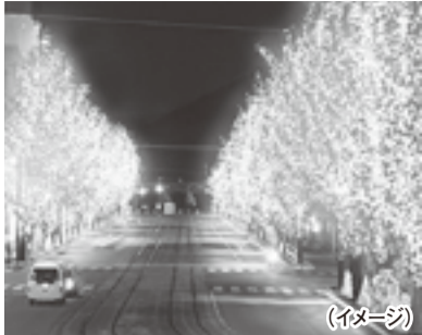
親しみやすい名前を募集

道後オンセナート 2014 12/24開幕 道後温泉本館改築120周年を記念し、「最古にして最先端。温泉アートエンターテイメント」をテーマに道後温泉本館とその周辺でアートフェスティバルを開催します。10月のプレイイベントを経て、12月24日から1年間にわたり、光や映像、作品展示で道後を彩ります。