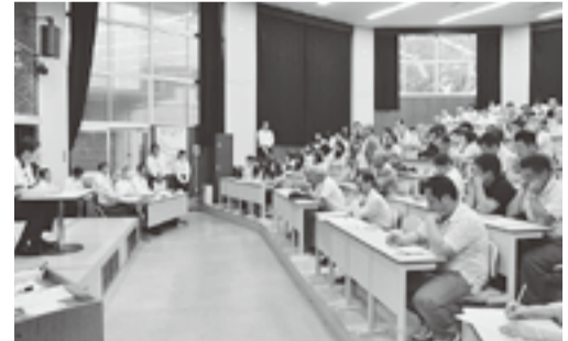
愛媛大学農学部の講堂が会場に