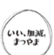
松山の魅力「人の温かさやいろいろなものがよくそろったちようどいい暮らし」を表す言葉「いい、加減。まつやま」のロゴマーク