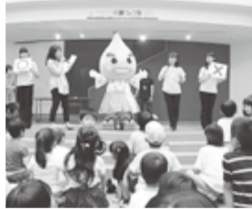
水道について楽しく学べるクイズもあるよ!

水道週間(6月1~7日)に、子どもが楽しめる実験ショーやゲームなどのイベントを開催します。ぜひご参加ください。 【日時】6月2日(日)11~15時 【会場】総合コミュニケーションセンター(湊町七丁目)こども館