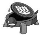
市下水道イメージキャラクター「かめまるくん」

下水道週間 (9月4日〜10日) 「下水道 お水がいつ てる また くるね」を 含言葉に下 水道の啓発 活動を行います。