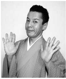
らくさぶろうさん

時々14時30分ミニコンサート ▼16日(日)10時30分〜11時 11時30分〜12時 12時〜13時 うさんによる落語▼16日(日)14 時〜14時30分、15時〜15時30 分 紙芝居▼ガラポン大会 むかしあそびなど