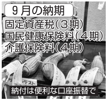
9月の納期 固定資産税(3期) 国民健康保険料(4期) 介護保険料(4期) 納付は便利な口座振替で

①中小企業で働く従業員の福利厚生に共同で取り組む市勤労者福祉サービスセンターの愛称 ※最優秀者には賞状および賞金3万円贈呈 ②市内に在任または通勤している人 ③9月30日(日)(必着)。郵送。eメール。応募用紙(地域経済課)市役所本館8階、市民課(市役所本館1階)、支所、市民サービスセンター、公民館、市ホームページなど(にあり)を〒790-8571市勤労者福祉サービスセンター(地域経済課内) ☎kinrousyu@city.matsuyama.ehime.jp ④地域経済課 ☎948-6399・FAX 934-1844