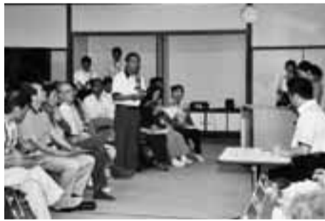
地区の魅力を話す参加者

る限り機「音」という句を詠むなど、当時のかすり産業の繁栄ぶりがうかがえます。露月邸は老朽化により取り壊され、再建されています。垣生小学校では、俳句クラブや俳句の小径が設けられ、地域の伝統産業や文化を次世代に伝える取り組みが行われています。