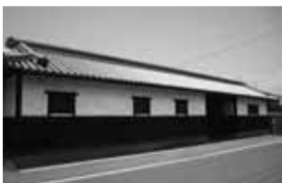
再建された露月邸の長屋門

並び、あちこちから機械の音が聞こえていたそうです。今では、かすり工場はなくなりましたが、5月28日には毎年、カナの功績をたたえる鍵谷祭が盛大に開かれています。またカナが眠る長楽寺には、鍵谷カナ頌功堂が設けられ、エンタンスの様式の8本の柱が本瓦ぶきの屋根を支える造りがあり、県庁本館や萬翠荘などを設計した木子七郎によるもので、国の登録有形文化財になっています。俳人の村上露月や石田波郷の生誕地で、俳句が盛んな土地柄でもあり、露月は正岡子規とも交流があり、「花木樞家あねた子規が」花木樞家あ