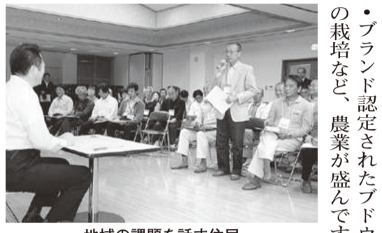
地域の課題を話す住民