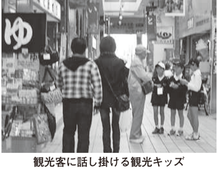
観光客に話し掛ける観光キッズ

このない子どもたちもおり、その気持ちよさにうっとりしたようです。また市とのタイアップで行っている「まつやま観光キッズ」も楽しみの一つで、自作のイラストを添えたティッシュや観光案内パンフレットを配り、観光客に道後の魅力を紹介しました。初めはなかなか声を掛けられな