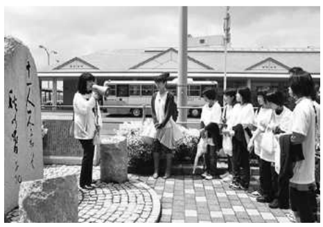
松山を案内する達人ガイド

回6月11日・25日、7月9日、23日、8月13日・27日。月曜日15~16時 会松山センタービル(三番町四丁目)会議室ほか 因「松山はいく」ガイド・コーディネーターによる座学研修 申6月10日(日)16時まで。eメールで住所、氏名、年齢、性別、電話番号を「松山はいく」事務局 matsuyamahaiiku@gmail.comへ 問松山はいく事務局☎9456445・☎9346626、観光産業振興課☎9486555・☎9341764