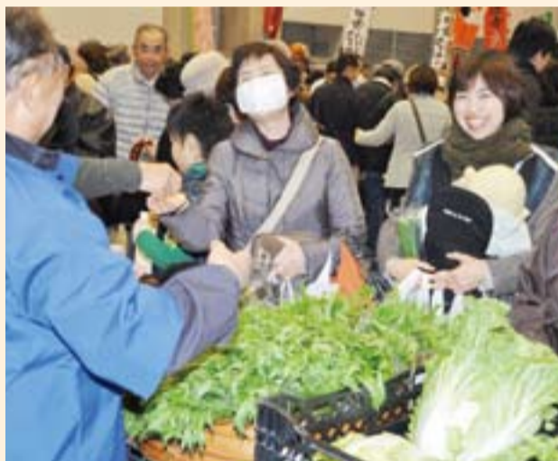
旬の野菜を前に生産者との会話に笑顔がこぼれる

「第6回まつやま農林水産まつり」が2月18・19日、アイテムえひめで開催され、2日間で約3万8000人の人出でにぎわいました。 今年75団体が出展し、松山でとれた旬の野菜や果物、瀬戸内海の新鮮な魚や加工品の展示・販売が行われ、来場者は松山の味を満喫しました。 18日に行われたオープニングセレモニーでは、野志市長