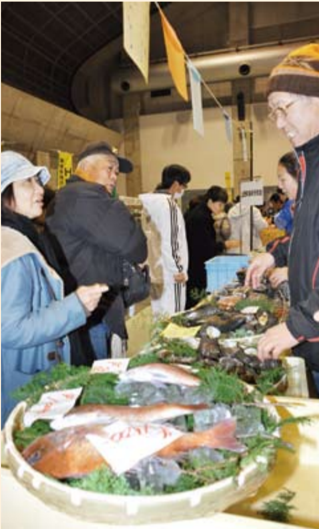
瀬戸内海でとれた新鮮な魚介類が並ぶ