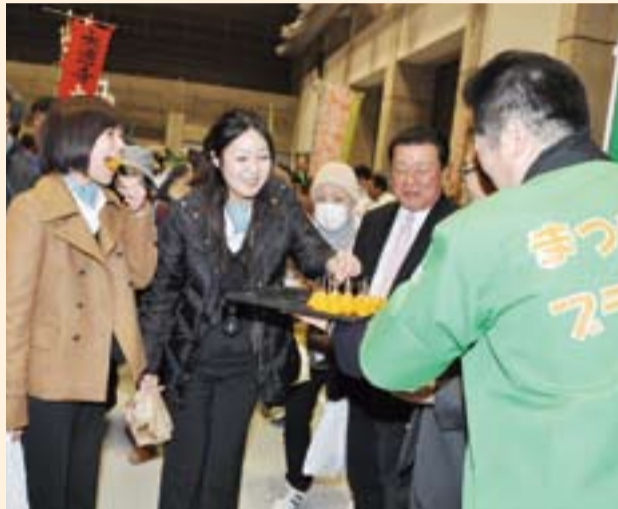
まつやま農林水産物ブランド「せとか」を試食