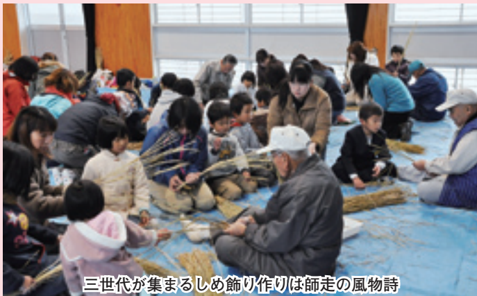
三世代が集まるしめ飾り作りは師走の風物詩