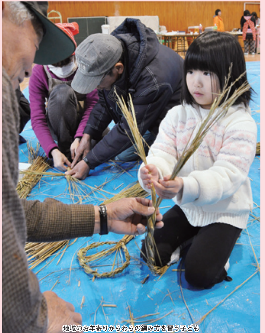
地域のお年寄りからわらの編み方を習う子ども